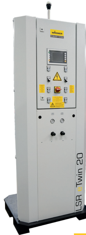
LSR eTwin 20