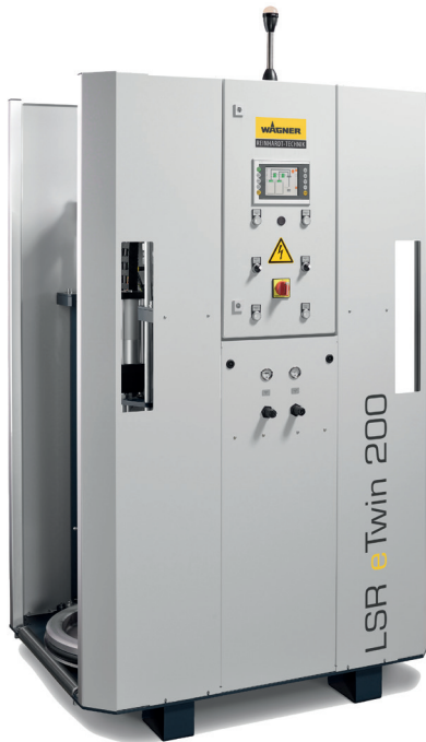
LSR eTwin 200

Anlagen und Zubehör Plants & Accessoires